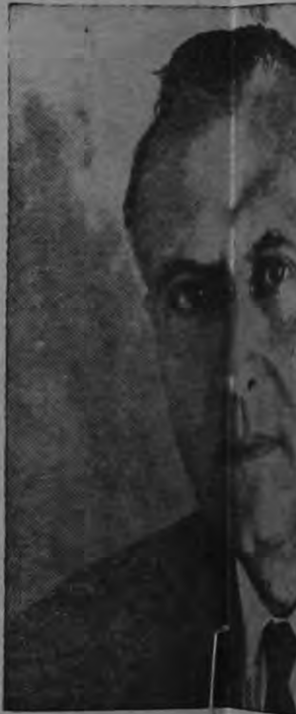
Dr. Rafael Angel Calderón Guardia, Jefe y Presidente del Partido Republicano.

LIBERACIÓN PACTO DIRECTAMENTE CON VANGUARDIA POPULAR